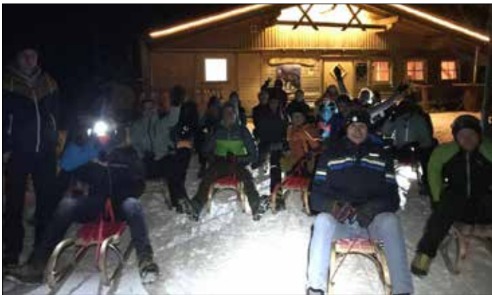
Rodelausflug nach Kals