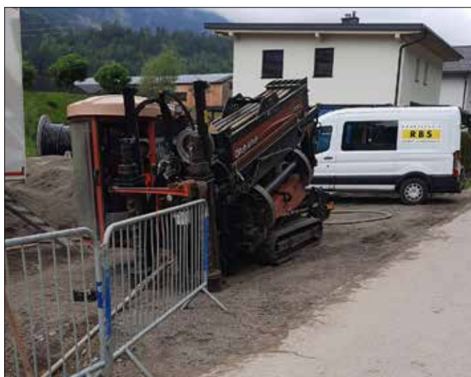
Mit diesem Bohrgerät der Firma RBS wurden Leerrohre für Stromkabel und Glasfaserkabel unter der Gwabler Landesstraße sowie unter der Felbertauernstraße im Bereich der Schlaitener Kreuzung durchgepresst.