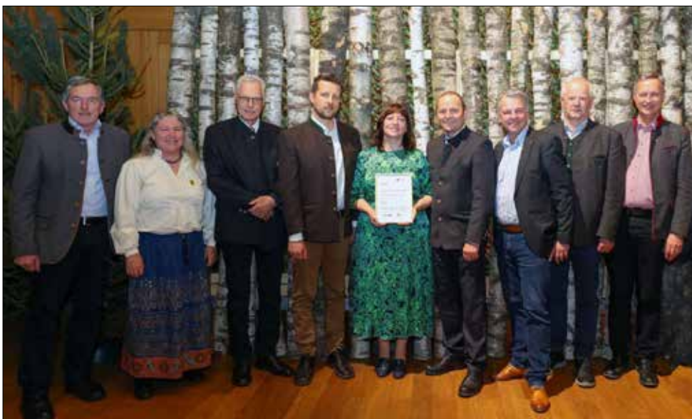
Alpenländischer Schutzwaldpreis 2024 in Schaan/Liechtenstein: