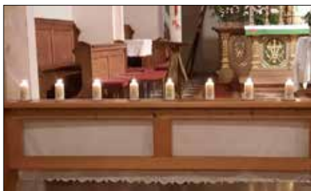
Wunderschöne Kerzen an alle Neugetauften in der Pfarre Ainet.

Am 2. Februar, bei der hl. Messe, durften wir auch heuer wieder wunderschön gestaltete Kerzen und ein Namens- und Heiligenbüchlein an die Eltern von acht neugetauften Kindern überreichen. Dies ist in unserer Pfarre seit vielen Jahren Brauch.