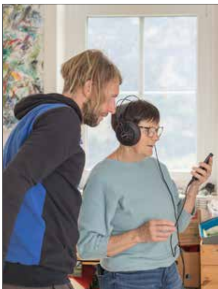
Kunst und Musik - eine interessante Mischung.

Aktuelle Ausstellungen unter www.rolu.geisberg.at