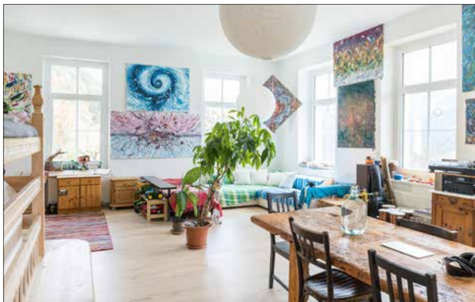
Die Werke des Aineters Künstlers werten das ehemalige Klassenzimmer im Gwabler Schulhaus auf.