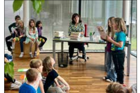
Und auch die Kinder durften aus ihren Lieblingsbüchern vorlesen.

Anschließend durften auch wir SchülerInnen Frau Staller zeigen, wie gut wir alle lesen können. Gegenseitig wurde eifrig vorgelesen, aufmerksam zugehört und auch viel gelacht.