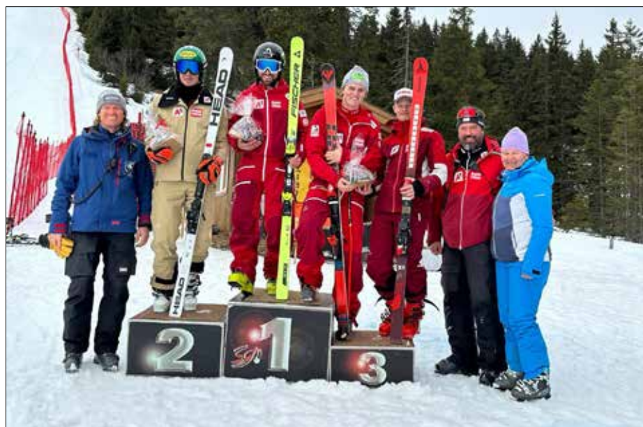
Bei den österreichischen Juniorenmeisterschaften holte sich Nica im Riesentorlauf die Bronzemedaille.

bedeutete auch, dass er die Junioren Weltmeisterschaften aufgrund seiner Verletzung verpassen musste, was zweifellos eine enttäuschende Erfahrung für ihn war.