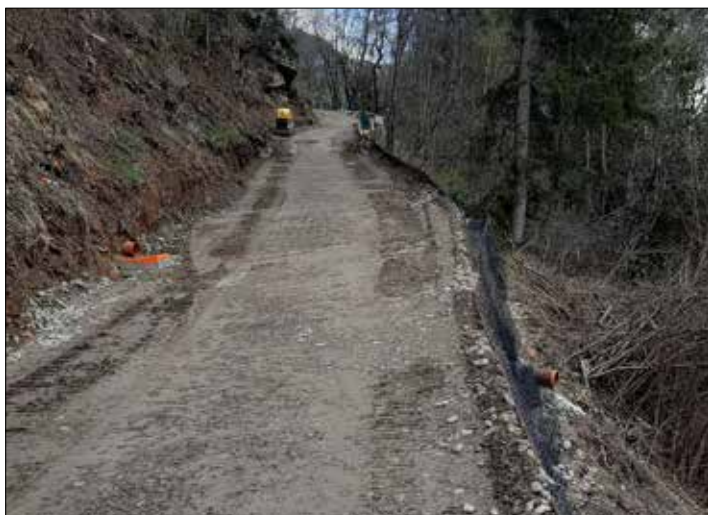
Ein Teilstück der Weganlage Förster musste mit bewehrter Erde aufgebaut werden.

te und mit deren Mitarbeitern auch ausführte, auf Stand der Technik gebracht. Aufgrund eines Weganbruches konnte eine Teilstrecke über Mittel aus dem Katastrophenfonds finanziert werden. Für den weiteren Streckenabschnitt gibt es eine schriftliche Zusicherung vom Amt der Tiroler Landesregierung für eine außerordentliche Bedarfszuweisung. Allen Beteiligten darf hiermit nochmals ein großer Dank ausgesprochen werden.