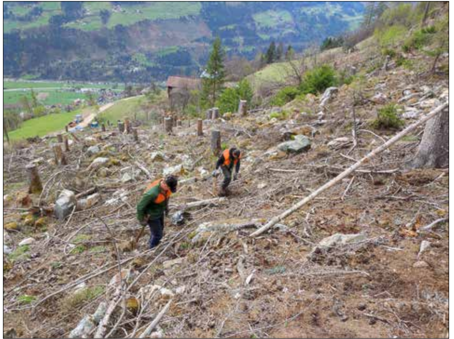
Viele fleißige Hände sind notwendig, um die Aufforstung innerhalb der möglichen Zeitspanne von 8 Wochen zu erledigen.

Zum Käferholz kamen aufgrund von Sturm noch einige tausend Festmeter an Windwurfholz dazu.