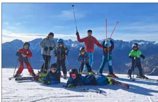
Traumhafte Bedingungen herrschten bei den heurigen Schitagen am Zetttersfeld.

Die Sportunion Schlaiten und die TSU Ainet veranstalteten auch dieses Jahr wieder die Schitage für wintersportbegeisterte Kids am Zetttersfeld. Von 14.02. bis 17.02.2024 waren rund 40 Kinder mit ihren „Schilch-