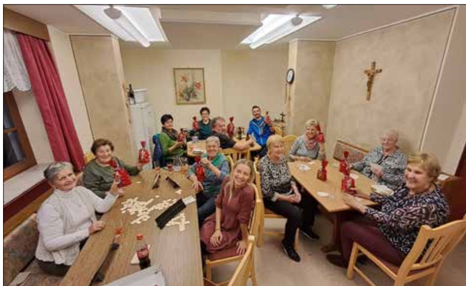
Besuch der Landjugend im Seniorenstüberl.