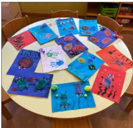
Die Kindergartenkinder konnten ihre eigene Unterwassertierwelt basteln.