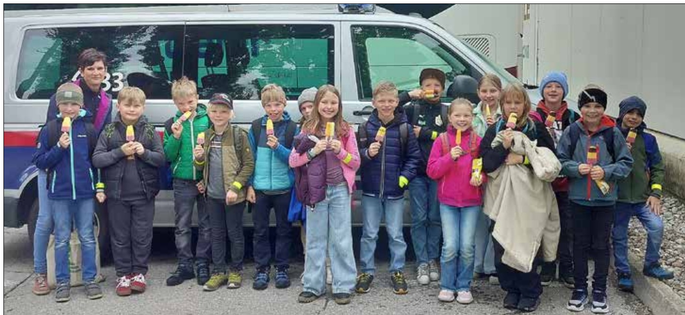
Ein Eis zum Abschluss der Polizei-Bezirkstour ließen sich die Kinder der VS Ainet besonders schmecken.