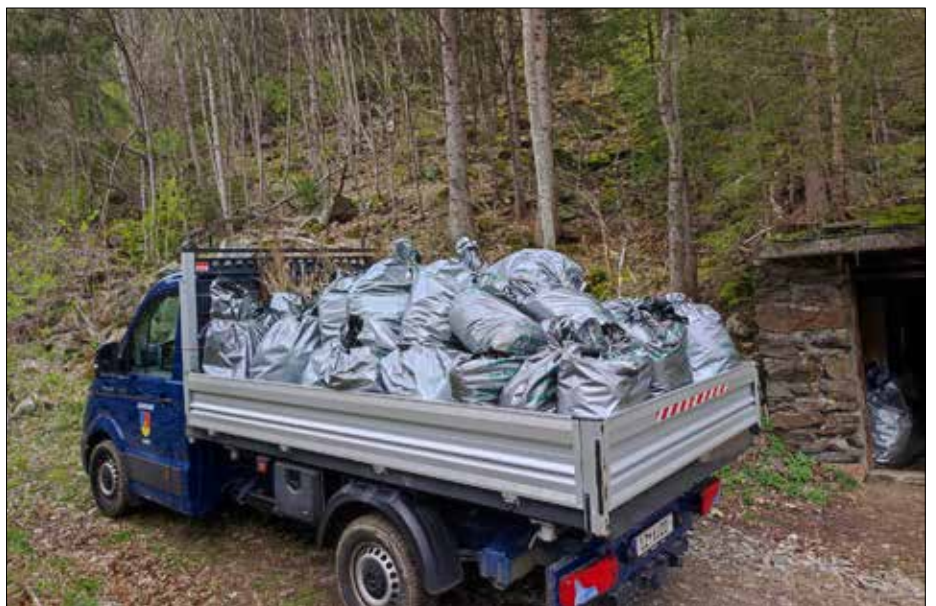
Insgesamt 60.000 Setzlinge wurden im Landesforstgarten für die Aufforstung unserer Bergwälder geholt.