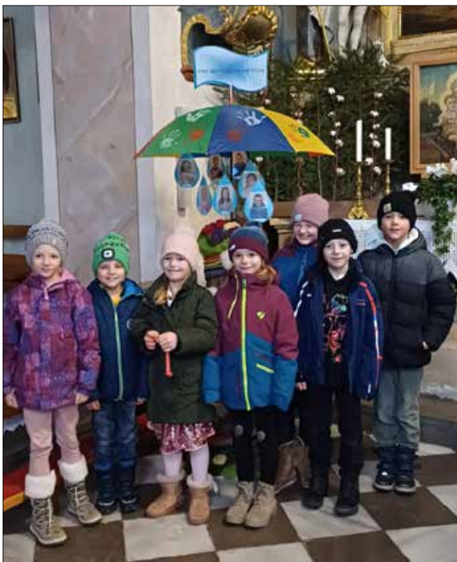
„Unter Gottes Schutz und Schirm“ war das Thema für die heurige Erstkommunion.