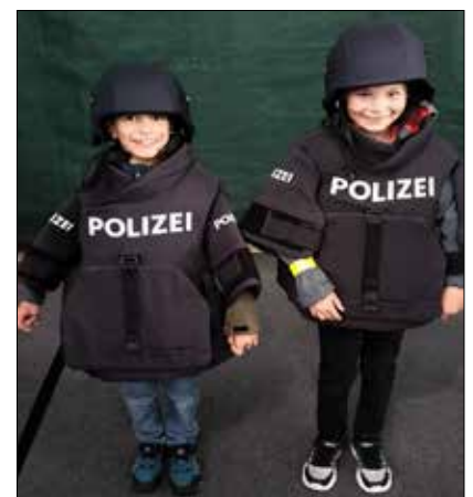
Natürlich durfte die Ausrüstung der Polizei auch ausprobiert werden.

Das Eis zum Abschluss der tollen Veranstaltung ließen wir uns natürlich besonders schmecken.