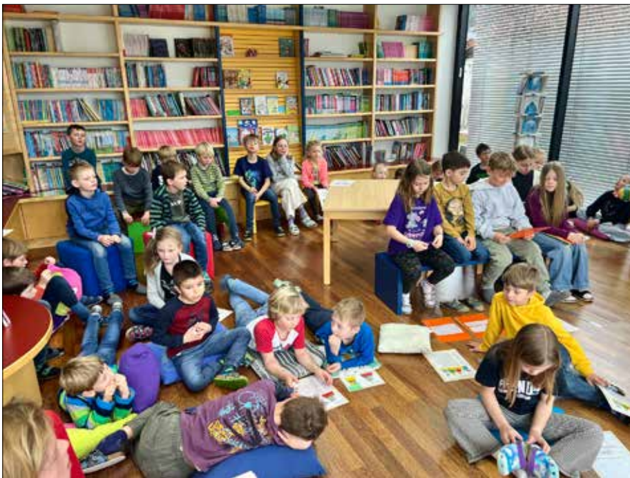
Die Kinder der VS Ainet versammelten sich in der Schulbibliothek und warteten gespannt auf die spannenden Geschichten ihrer Bürgermeisterin.

Die Geschichte, die sie uns aus einem ihrer Lieblingsbücher vorlas, gefiel uns allen super. Vielen Dank, liebe Frau Bürgermeisterin, für deinen Besuch!