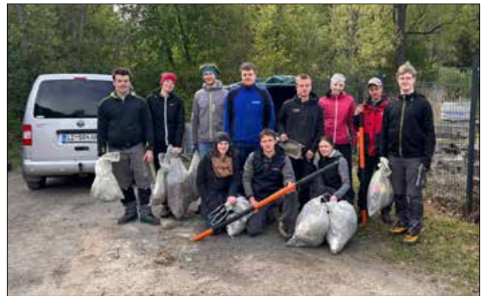
Auch beim Frühjahrsputz waren die „Hos'nkrax'n“ wieder stark vertreten.