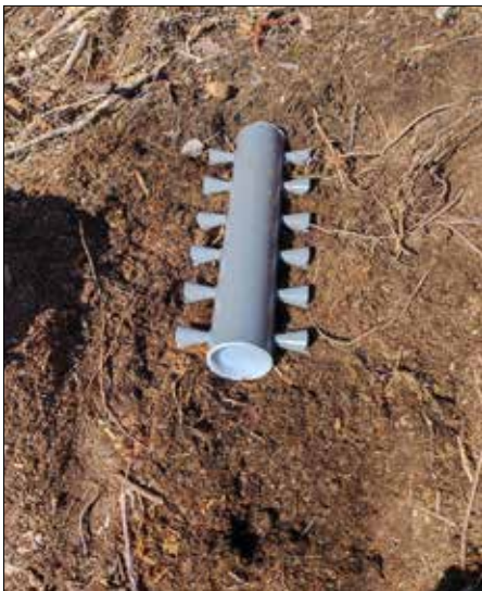
Rüsselkäfermonitoring mittels sogenannter Rohrfallen.

Parallel dazu geht die Aufarbeitung unseres Schadholzes weiter.