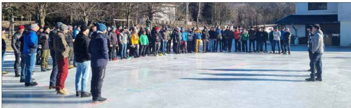
Besprechung des Ablaufes der heurigen Dorfmeisterschaft.