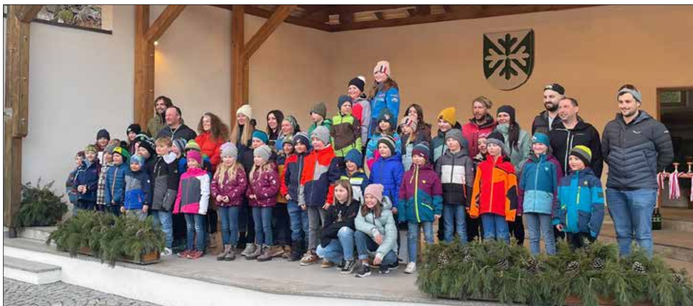
Strahlende Gesichter bei der Preisverteilung im Pavillon Schlaiten.