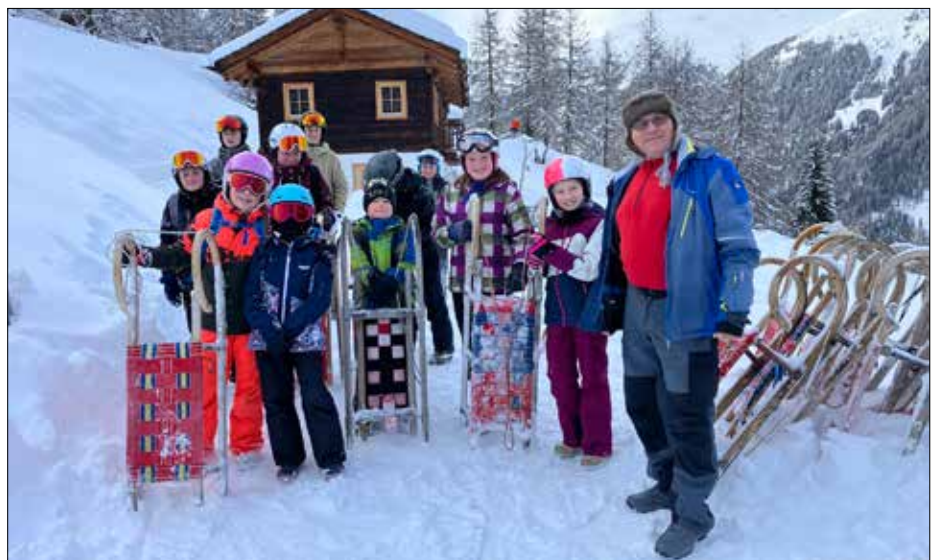
Unser Herr Pfarrer begleitete die Ministrantinnen und Ministranten auf die „Alpe Stalle“ in St. Jakob i. Def.