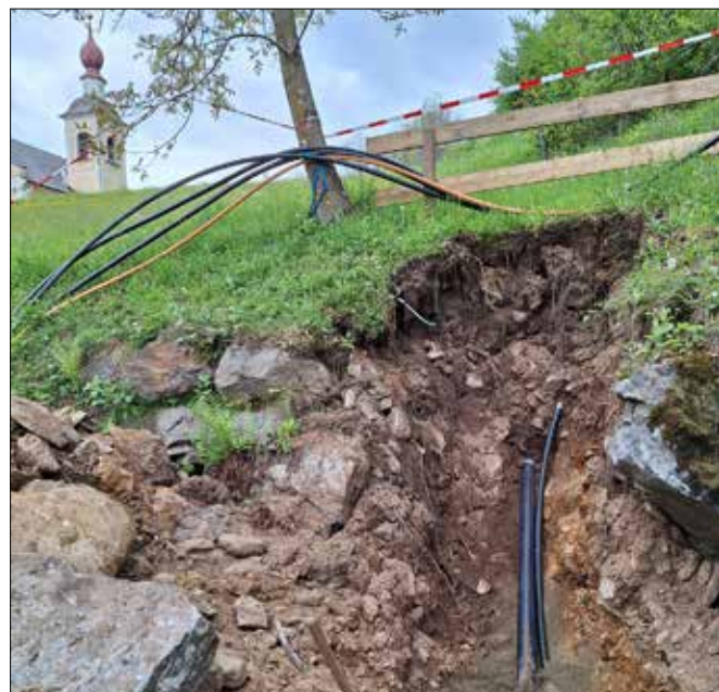
Auch bei Verkabelungen in Gwabl, Versorgungsgebiet der TIWAG/TINETZ GmbH beteiligt sich die Gemeinde Ainet in entsprechenden Teilbereichen, um Glasfaserkabel kostengünstig mitzuverlegen.