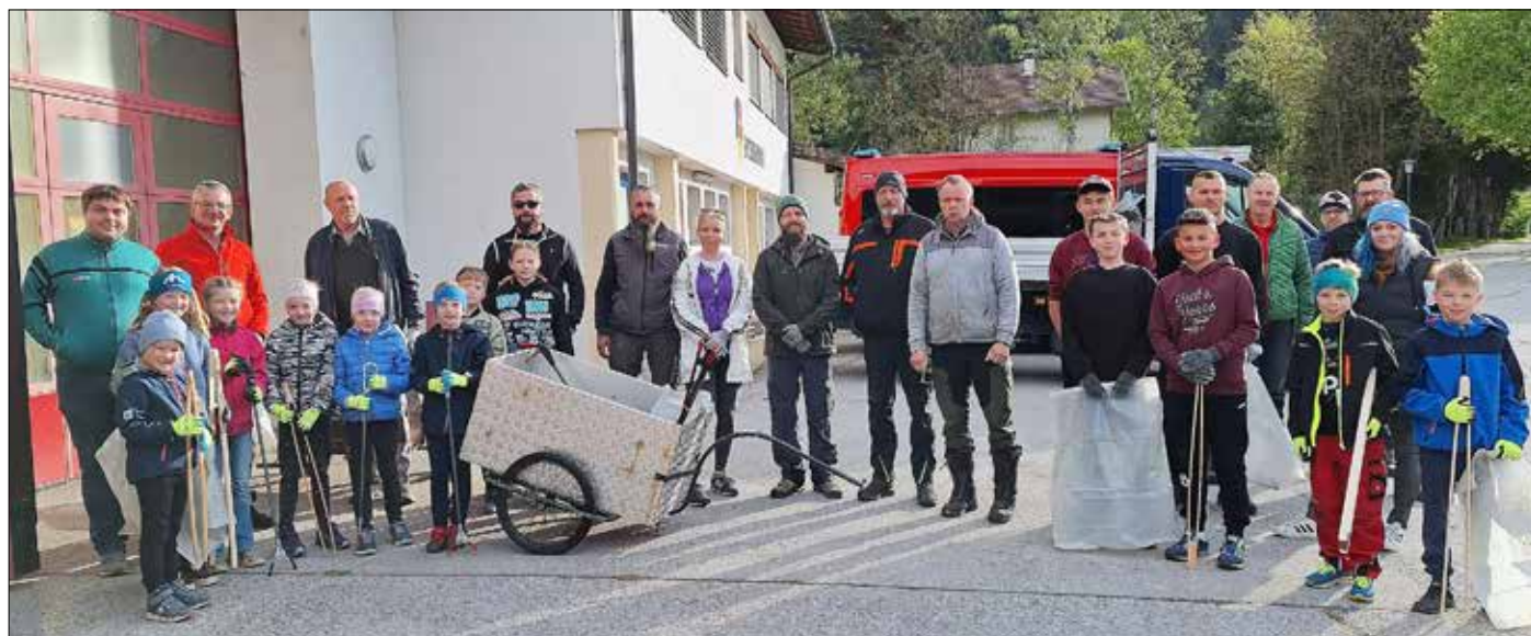
Gemeinsamer Treffpunkt beim Feuerwehrhaus und Einteilung der Gruppen.

zu diesem erfolgreichen Tag geleistet haben. Ihr Einsatz und Ihre Unterstützung sind ein wertvoller Beitrag für eine lebenswerte und saubere Umgebung in Ainet.