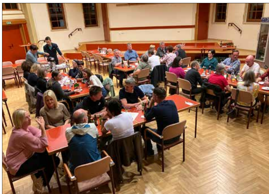
Mit einem gemeinsamen Abendessen wird allen Ehrenamtlichen gedankt.